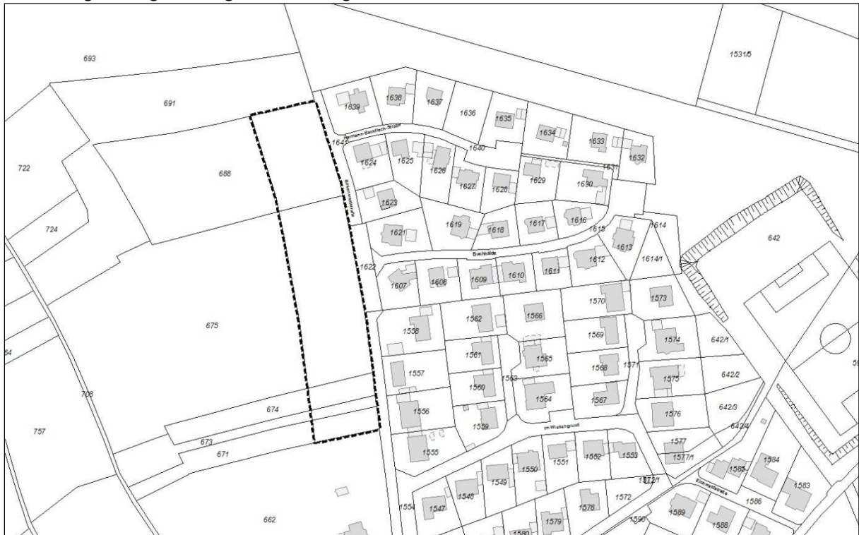
Abbildung 2: Abgrenzung des Geltungsbereiches

Darstellung unmaßstäblich, Kartengrundlage: LGL Baden-Württemberg (Hrsg.), unbeglaubigter Auszug aus der automatisierten Liegenschaftskarte vom 11.04.2017