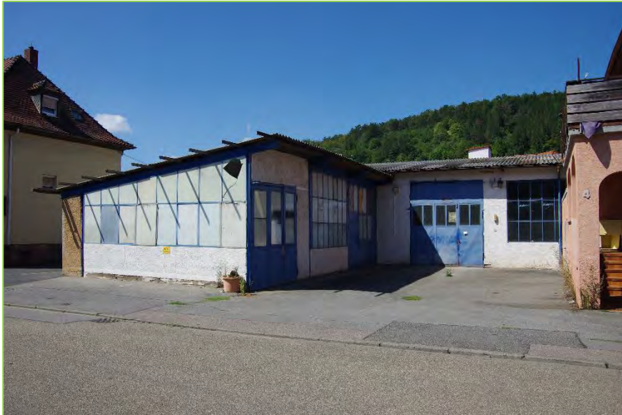
Ansicht von der Brühlstraße